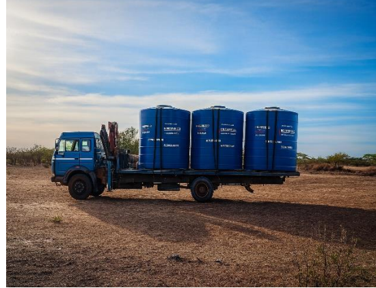
Vista de la preparación para la perforación, un de un pozo terminado y de los tanques instalados, mostrando el logotipo del Fons y de AFIS.