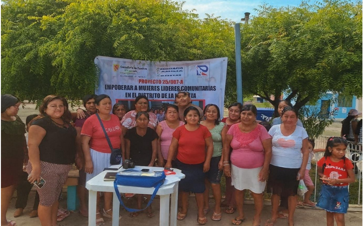
Asociaciones de mujeres del Centro Poblado Laynas de la municipalidad del distrito La Matanza, Piura, Perú.

La familia es la base de la sociedad, es el sustento para la creación de hombres y mujeres de bien.